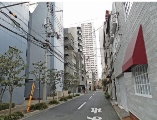
賃貸住宅は家賃に見合った、立地・周辺環境等の「条件」と、宅配ボックス・温水洗浄便座等の「設備」が備わって総合的に評価されている

入居者に満足してもらい、長く入居してもらうコツは、このように入居者に対して常に「顧客満足度」を感じてもらえるサービスの充実を