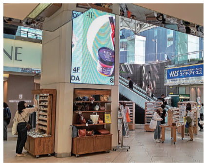
諸物価高騰や経費上昇の影響が懸念されています

国土交通省が公表した2025年の11月と第3四半期の「不動産価格指数」によると、住宅総合は前月比0・7%増の147・3、商業用不動産総合は前期比で1・1%増の147・2となりました。