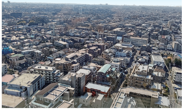
賃貸市場の多様性、住宅の性能アップは着実に広がりを見せています

賃貸住宅に関連するニュースを紹介します。今日、住まいに関連する技術や多様性の発展には、目を見張るものがあります。賃貸住宅も同様、様々な変化を遂げています。