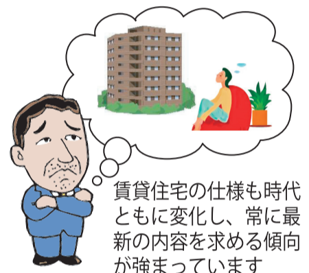
賃貸住宅の仕様も時代とともに変化し、常に最新の内容を求める傾向が強まっています

新築賃貸物件の設計担当者が「燃費のいい賃貸住宅」の性能を分かりやすく紹介。実際の物件で撮影することで、暮らしの中で感じられる快適性や光熱費削減といったメリットをよりイメージしやすくなっています。物件を探す若年層にも役立つ、住まい選びの新しい視点を提供する内容です。