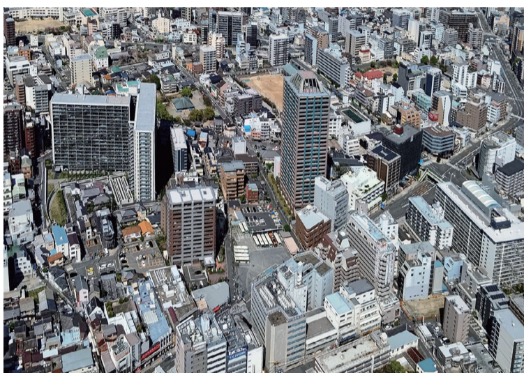
景気の改善基調が続く中、「家賃相場」が2026年新春市場で、どのような弾みを見せるのか、注目されます

年が明けての不動産市場活況の流れは、昨年と大きくは変わらな思われますが、「家賃相場」が2026年新春市場で、どのような弾みを見せるのか、注目される点です。そして、今年の新しい傾向としては、国が大型予算で立ち上げる「みらいエコ住宅2026事業」の創設により、いよいよ賃貸住宅の省エネ化の動きが加速しそうです。